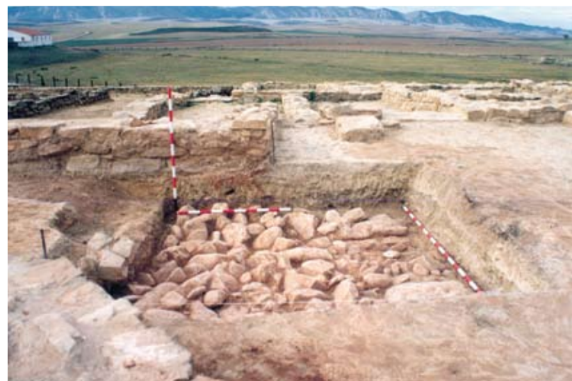
Sala de prensado