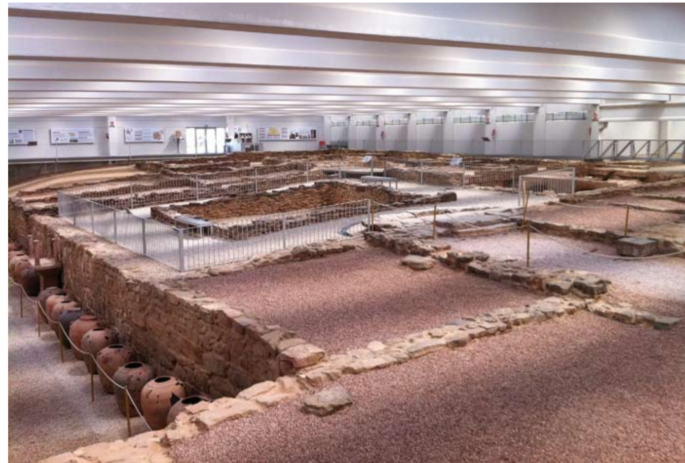
Vista general del Yacimiento