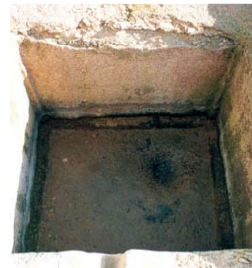
Cámara de humo

Estancia destinada a cocer, salar y perfumar el mosto. Constaba de un patio, porticado en sus lados este y norte, en cuyo centro se situaba un hogar de grandes dimensiones. En el centro de la sala, al aire libre, se ubicó el hogar, formado por dos capas de grandes piedras y cantos rodados que rellenaban el espacio rebajado en el terreno virgen. Las piedras y la tierra presentaban un color rojizo debido a la acción prolongada del fuego. Es probable que este hogar, salvo en época de vendimia, también desempeñara funciones domésticas, como cocina.