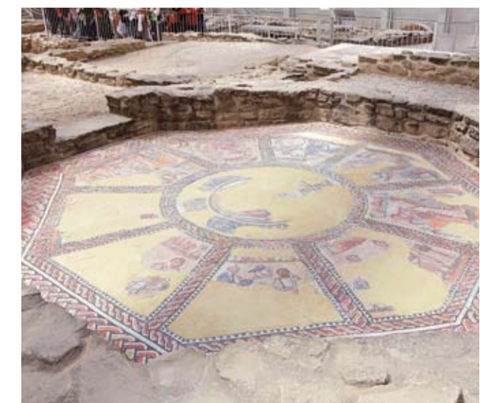
Mosaico de las Musas

Construcción aislada situada al sur de las estancias principales de la villa, de planta rectangular y con cubierta a dos aguas, que ha sido interpretado como establo.