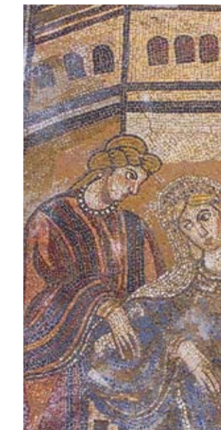
Detalle de los mosaicos