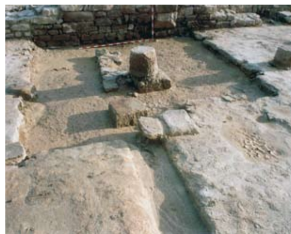
Sala de cocción

Estancia donde se envejecía el vino artificialmente, a través del calor y humo. El tejado, a dos aguas, estaba realizado con tejas muy similares a las que utilizamos hoy en día. Se sujetaba por un forjado de madera apoyado en ocho columnas de piedra de las que únicamente se han conservado los sillares de apoyo y alguna basa de columna. El suelo estaba formado por la propia roca natural que fue adaptada para conseguir una superficie horizontal. Se rellenaron con tierra algunos huecos que quedaban en el terreno virgen, consiguiendo así un piso uniforme.